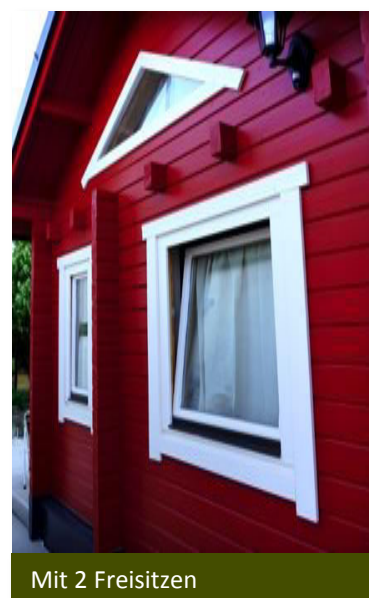
Mit 2 Freisitzen