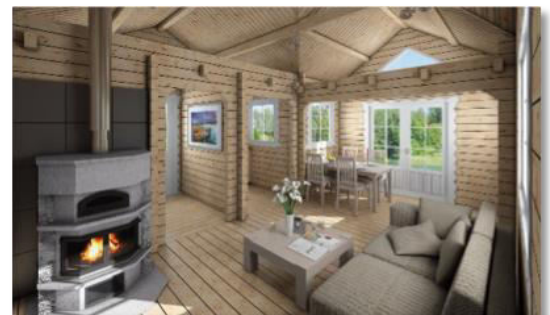
Großzügige und elegante Dachkonstruktion.